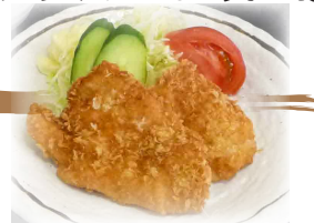
マンボウフライ(単品)