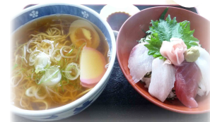
和風ラーメン &海鮮盛合丼(小)