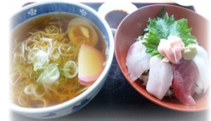
和風ラーメン & 海鮮盛合丼(小)