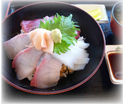
ー地みそ汁付きー